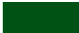
356 VERDE MEDIO