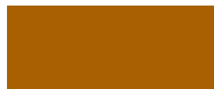
345 GIALLO TOSCANO