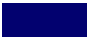
335 BLU COBALTO