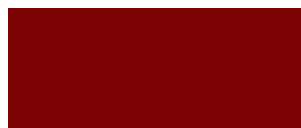
349 ROSSO OSSIDO