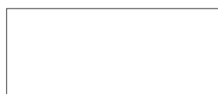
349 BIANCO LUCIDO

Le tinte del presente campionario sono soggette ad alterazioni e quindi hanno solo valore indicativo