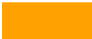
344 GIALLO GIRASOLE